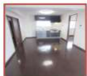
●ダイニング・キッチン

★三室・南東向きのお部屋！ バルコニー側は遮る建物がなく眺望良好です。 ★ハウスクリーニングも完了いたしました！！（写真をご参照ください） ★水まわり、居室とともに「清潔感を感じられるお部屋」をぜひ、ご覧下さいませ。