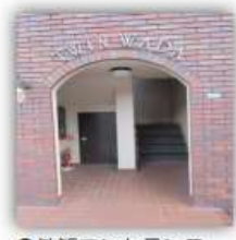
●外観エントランス