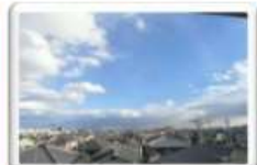
●バルコニーからの眺望